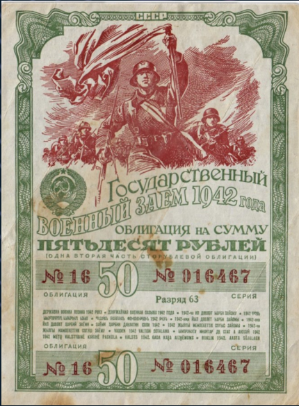
Облигация военного займа 1942 года, 50 рублей