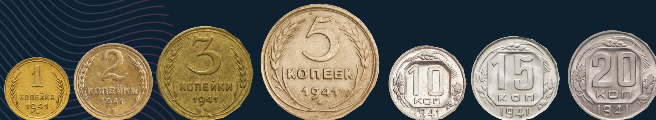
Разменные монеты, 1941 год