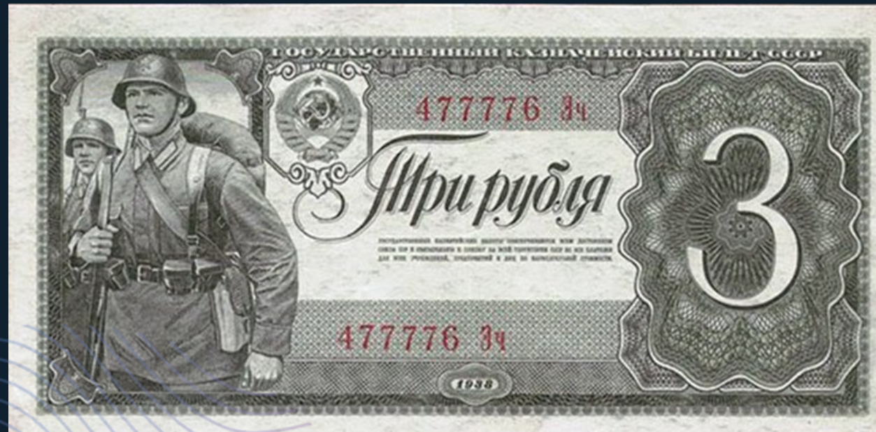
Государственный казначейский билет СССР 3 рубля образца 1938 года