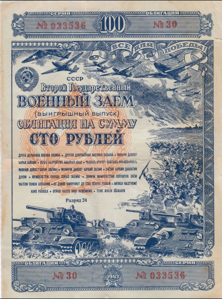
Облигация военного займа 1943 года, 100 рублей