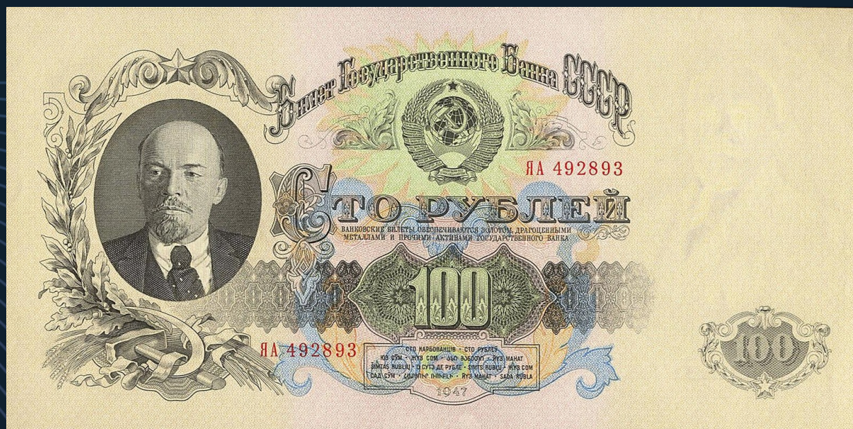
Билет Государственного Банка СССР 100 рублей образца 1947 года

Денежная реформа повлекла за собой и отмену карточной системы. Для того чтобы поддержать товарооборот были разбронированы товары из госрезерва на сумму почти 2 млрд рублей. Отмена карточного довольствия сопровождалась снижением государственных цен. Это был важный шаг вперед – символ преодоления послевоенных трудностей.