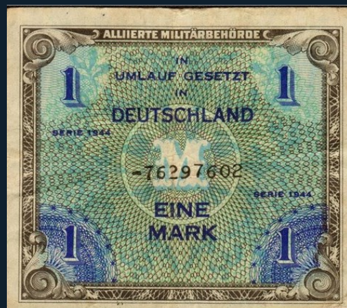
1 военная марка 1944 года