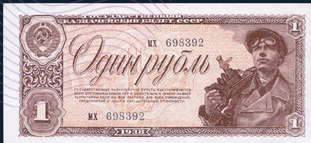
Государственный казначейский билет СССР

Купюры были выведены из обращения во время проведения денежной реформы 1947 года.