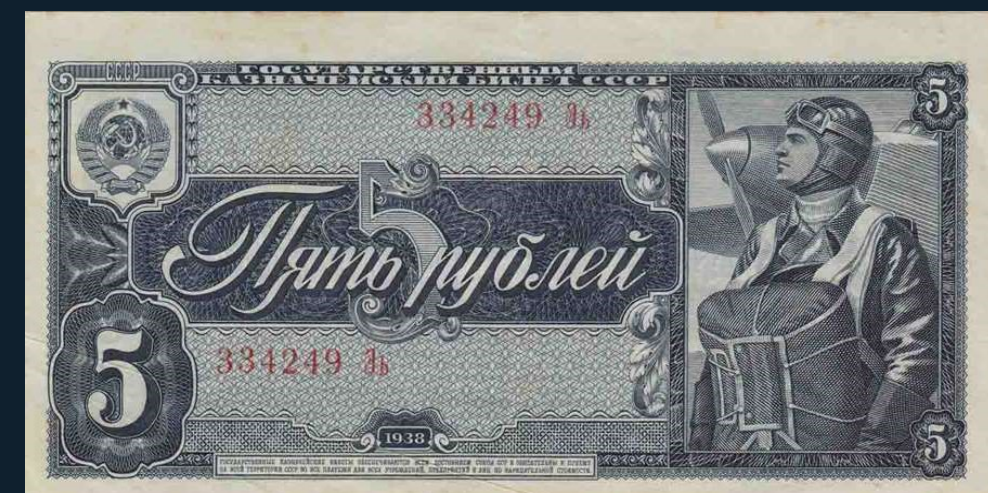
Государственный казначейский билет СССР