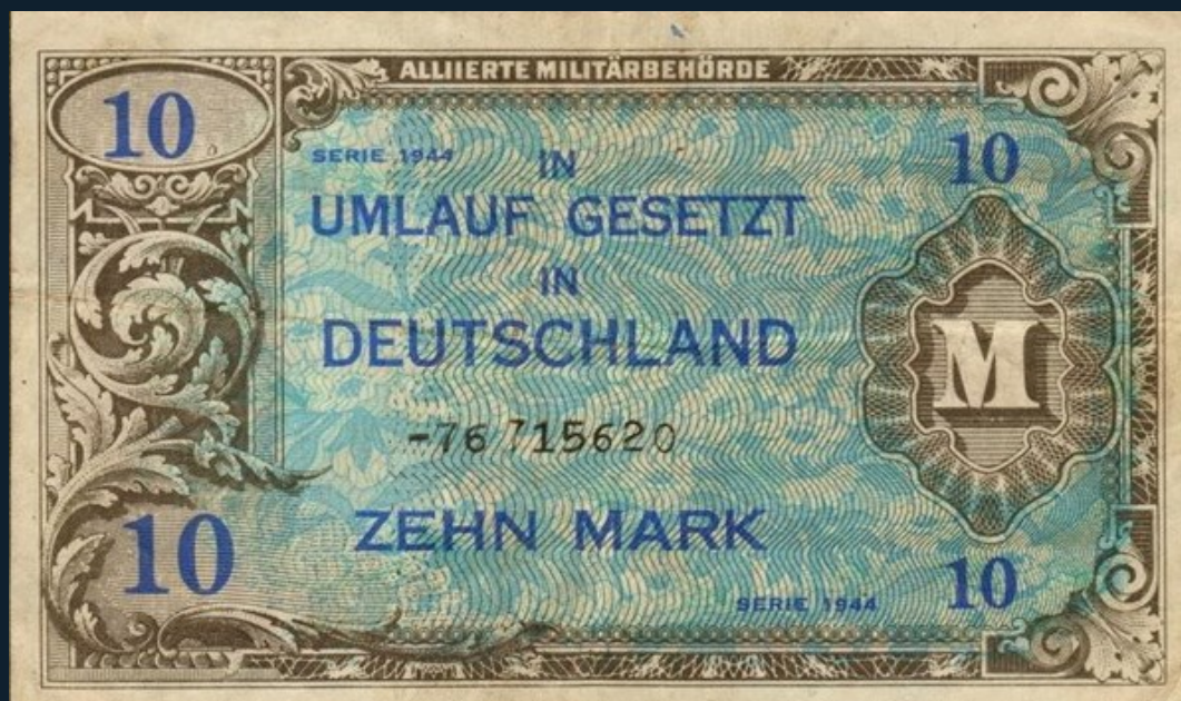
10 военных марок 1944 года. Со знака «-» обычно начинались серийные номера купюр, отпечатанных для советской зоны оккупации Германии