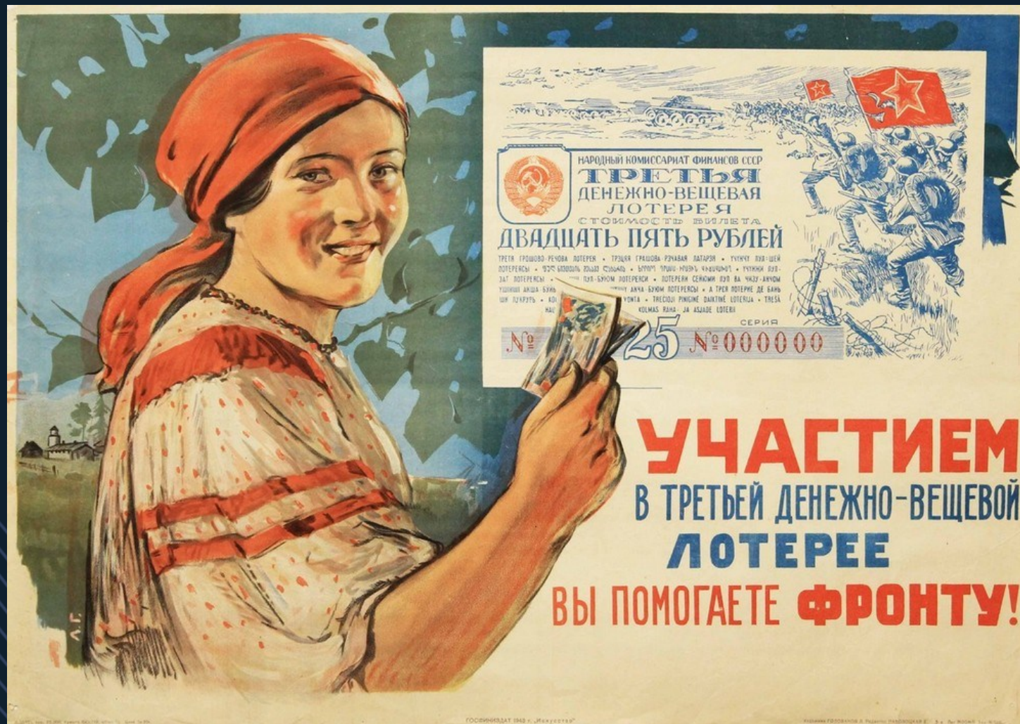
Билеты денежно-вещевой лотереи 1941-1945 годов