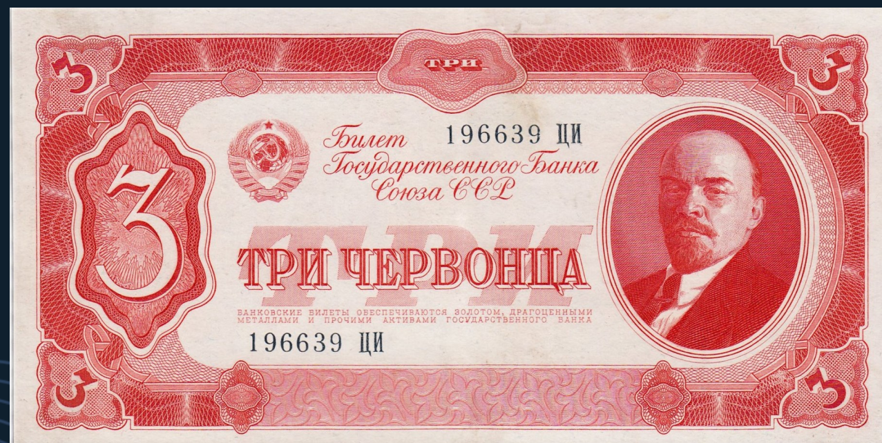
3 червонца образца 1937 года